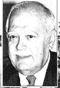
الرئيس عصام فارس