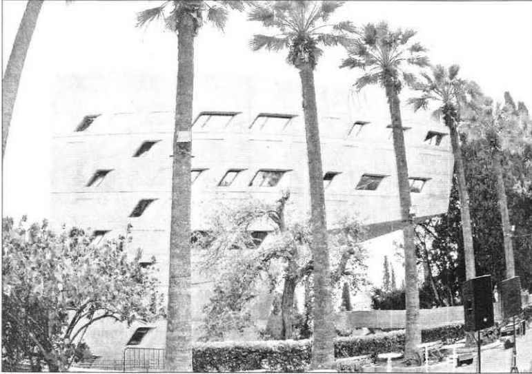
المبنى بهندسته المبتكرة