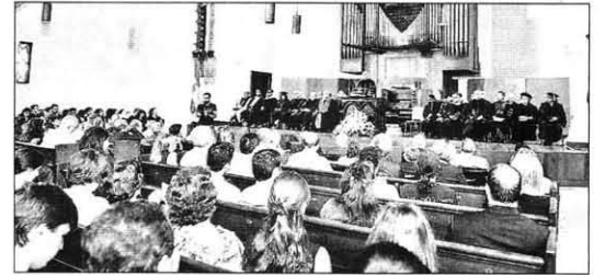
حفل افتتاح العام الدراسي في الجامعة الأميركية

أقامت الجامعة الأميركية في بيروت أمس احتفالاً رسمياً بافتتاح العام الدراسي الجديد، في قاعة الاحتفالات الكبرى «الأسميلي هول»، وألقى رئيس الجامعة الدكتور بيتر درومان خطاباً بعنوان: «التعليم الأميركي في شرق أوسط مضطرب». وقال: «النموذج التعليمي الأميركي لا يزال يعتبر النظام الأمثل في المنطقة رغم السجل السيئ للسياسة الخارجية الأميركية في العقد الأخير. أقامت الجامعة الأميركية في بيروت أمس احتفالاً رسمياً بافتتاح العام الدراسي الجديد، في قاعة الاحتفالات الكبرى «الأسميلي هول»، وألقى رئيس الجامعة الدكتور بيتر درومان خطاباً بعنوان: «التعليم