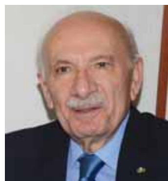
الرئيس حسين الحسيني