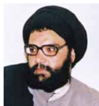
السيد عباس الموسوي