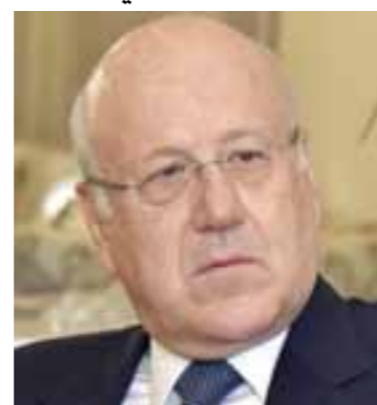
الرئيس نجيب ميقاتي