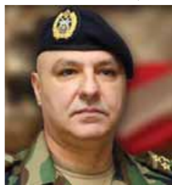
العماد جوزف عون