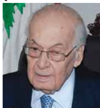
الرئيس سليم الحص