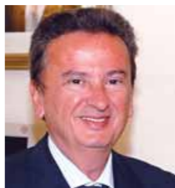
الحاكم رياض سلامة