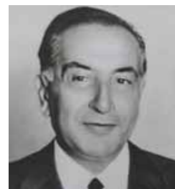
الرئيس فؤاد شهاب