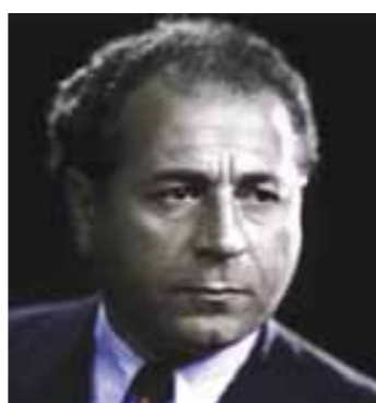
الزعيم انتون سعاده