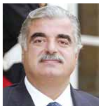
الرئيس الشهيد رفيق الحريري