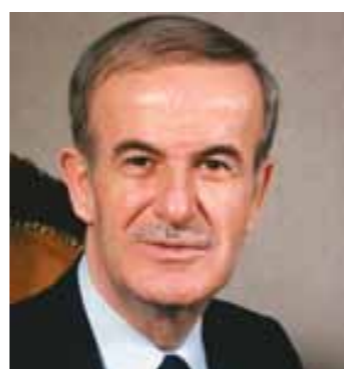
الرئيس حافظ الاسد