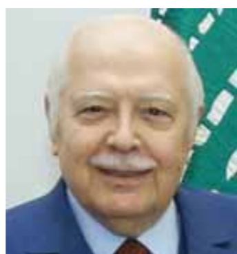
دولة الرئيس عصام فارس