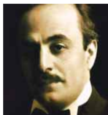
جبران خليل جبران