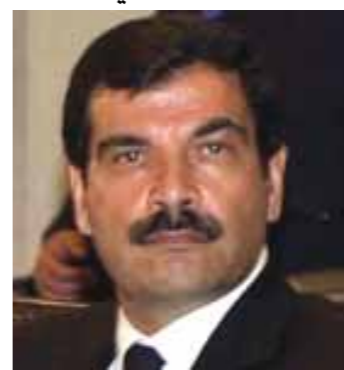
العماد آصف شوكت