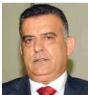
اللواء عباس ابراهيم